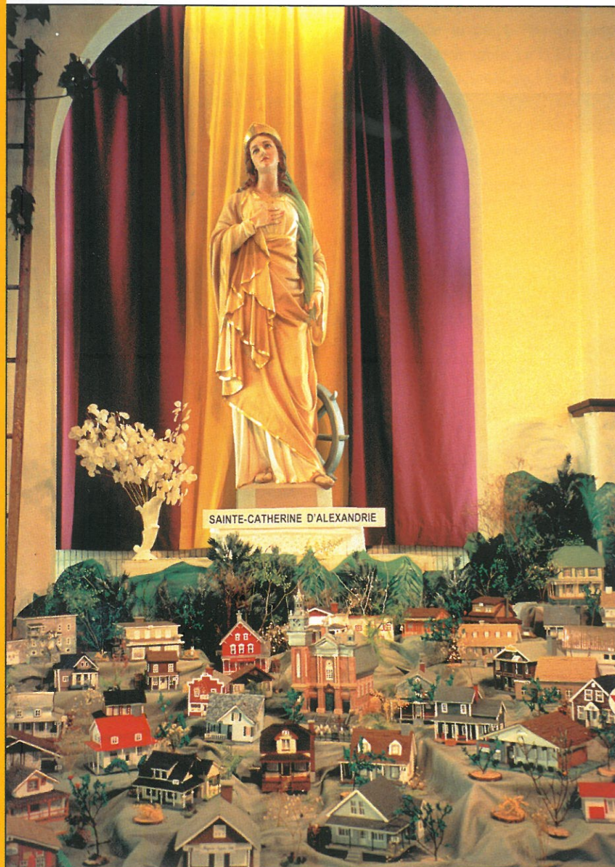
24 UN UNIVERS ENTRE CIEL ET MER